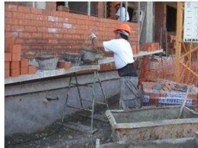
Figura X: Tareas de manipulación manual de cargas en el sector de la construcción

No obstante, los trabajadores deben tener en cuenta algunas recomendaciones que pueden ser de utilidad: